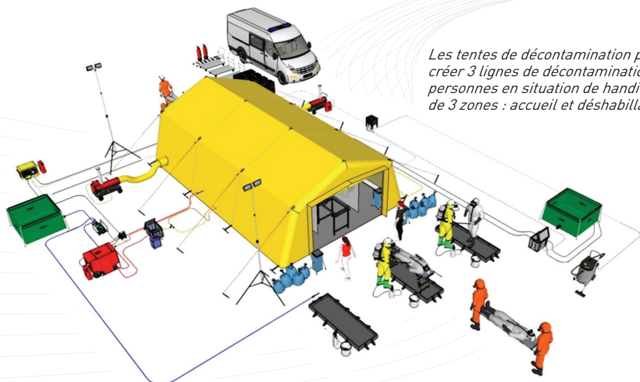
Exemple d'implantation d'un module de décontamination

Les tentes de décontamination peuvent être cloisonnées afin de créer 3 lignes de décontamination parallèles : hommes / femmes / personnes en situation de handicap. Chaque ligne étant composée de 3 zones : accueil et déshabillage / douche et rinçage / contrôle.