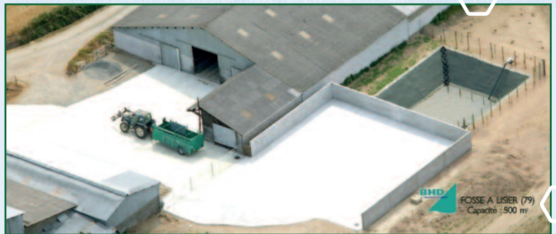
Partenaire BHD environnement